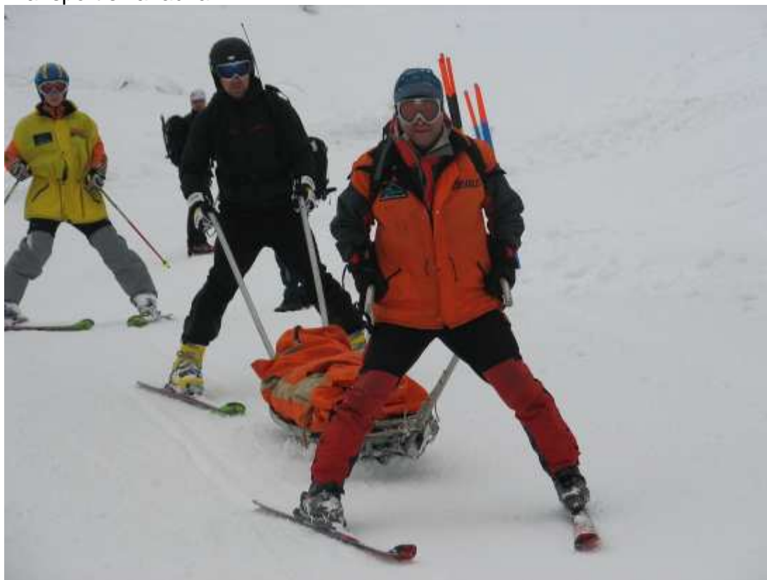
Transport z akijem