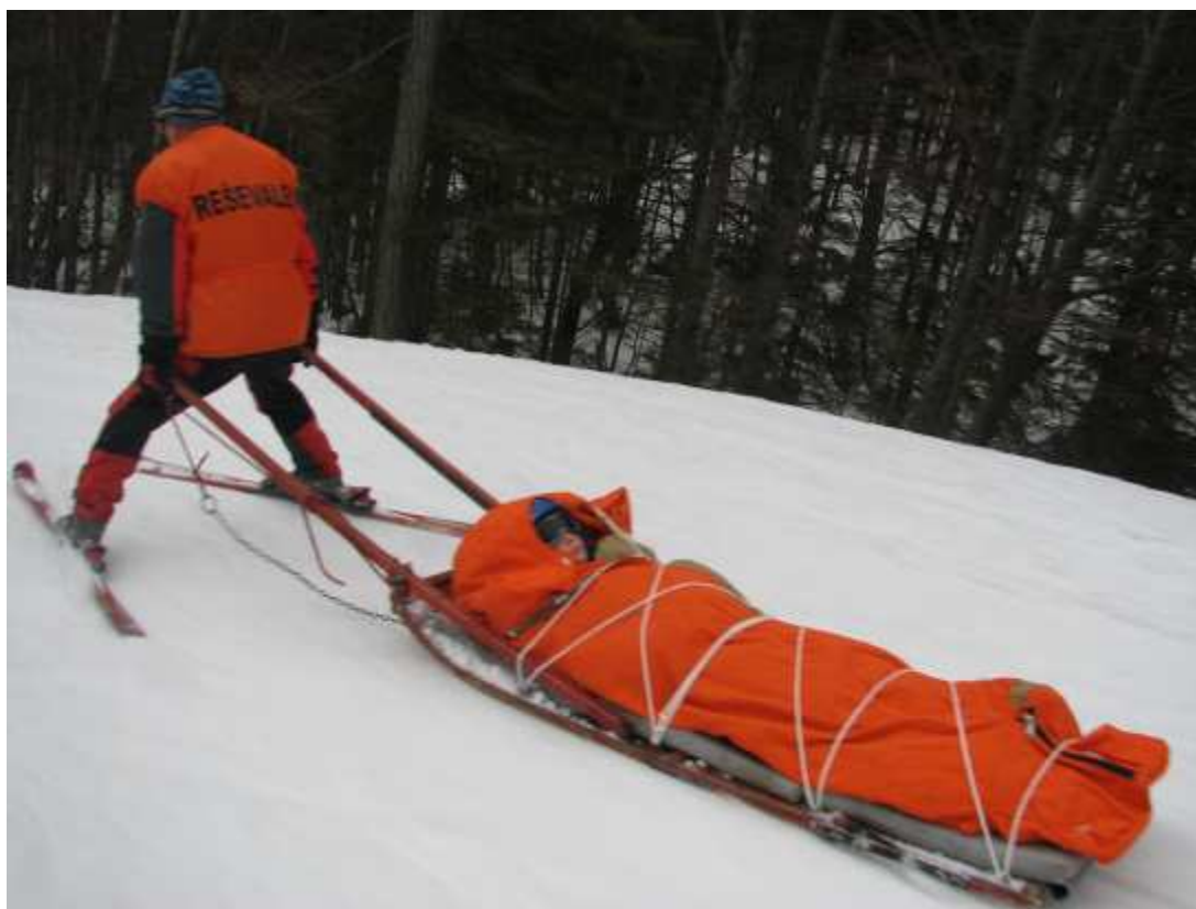
Transport s kanadkami